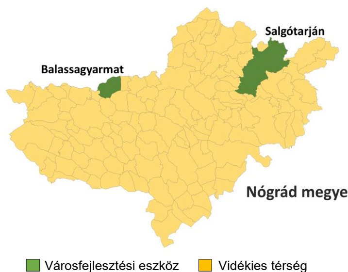
3. ÁBRA: KIJELOLT FEJLESZTÉSI CÉLTERÜLETEK

A kijelölt fejlesztési célterületeket az alábbi térkép mutatja be: