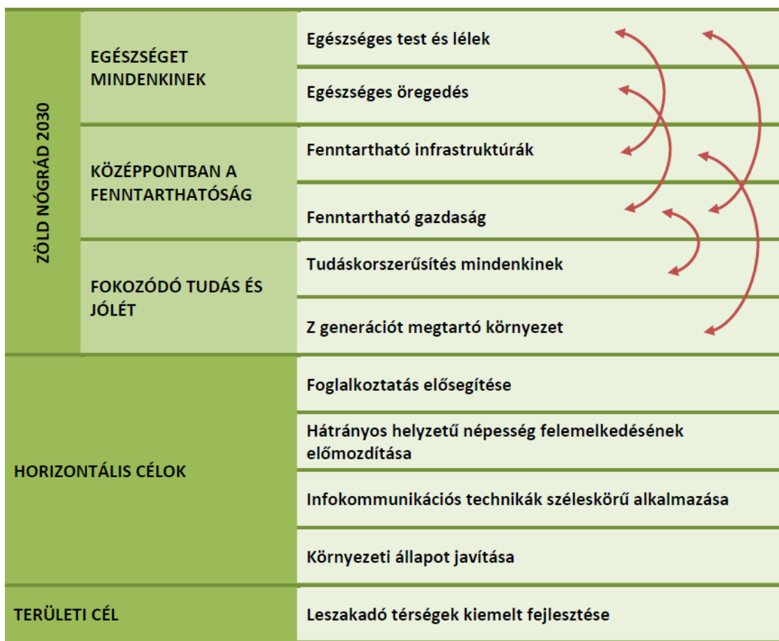
1. ÁBRA: NÓGRÁD MEGYE TERÜLETFEJLESZTÉSI PROGRAMJÁNAK CÉLRENDSZERE

Nógrád Megye Területfejlesztési Konceptiójának (2021-2027) javaslattevő fejezete rávilágít, hogy a felzárkóztatás stratégiái ezidáig nem hozták meg a várt eredményt, az elért fejlődési ütemmel a megye nem tudja utolérni az ország átlagos mutatóval rendelkező térségeit sem. Ebben a helyzetben a program offenzív fejlesztési logikára tesz javaslatot, amely az erősségekre és a lehetőségekre alapoz egy tematikusan felépített célrendszer mentén. A program célrendszerét és logikai összefüggéseit az alábbi ábra ismerteti: