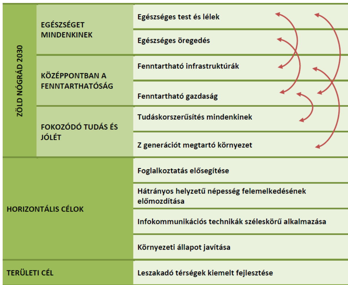
1. ÁBRA NÓGRÁD VÁRMEGYE TERÜLETFEJLESZTÉSI PROGRAMJÁNAK CÉLRENDSZERE

Nógrád vármegye területfejlesztési programja a kitűzött célok megvalósítása érdekében öt prioritást jelölt ki. A program prioritásait, intézkedéseit, illetve az intézkedések vármegyei fő célterületeit az alábbi táblázat foglalja össze: