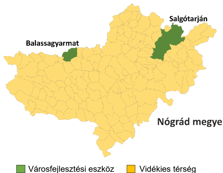
3. ÁBRA: KIJELÖLT FEJLESZTÉSI CÉLTERÜLETEK

A kijelölt fejlesztési célterületeket az alábbi térkép mutatja be: