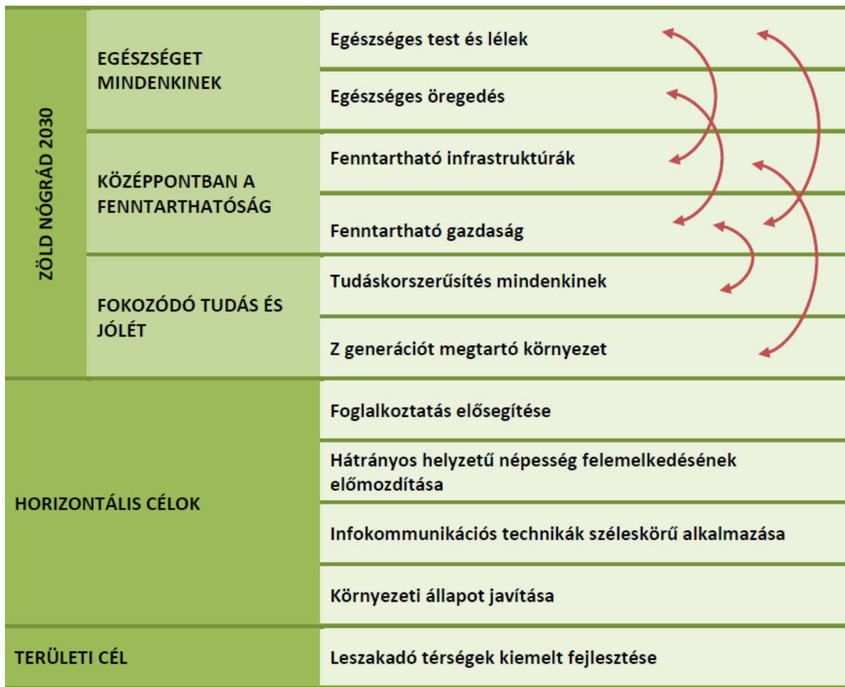
1. ÁBRA: NÓGRÁD VÁRMEGYE TERÜLETFEJLESZTÉSI PROGRAMJÁNAK CÉLRENDSZERE

Nógrád vármegye területfejlesztési programja a kitűzött célok megvalósítása érdekében öt prioritást jelölt ki. A program prioritásait, intézkedéseit, illetve az intézkedések vármegyei fő célterületeit az alábbi táblázat foglalja össze: