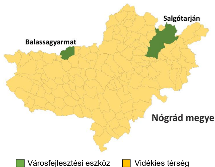
3. ÁBRA: KIJELÖLT FEJLESZTÉSI CÉLTERÜLETEK

A kijelölt fejlesztési célterületeket az alábbi térkép mutatja be: