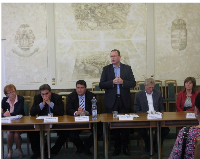
Balassagyarmat, szakmai konferencia

Az IH-val való többkörös egyeztetések eredményeként a kialakított felhívástervezeteknek a települési önkormányzatok minél szélesebb körével történő megismertetése érdekében 2015. október 7-én Salgótarjában, 8-án pedig Balassagyarmaton szakmai konferencia megrendezésére került sor, ahol a résztvevők a leendő pályázatok tartalmáról, a támogathatóság feltételeiről és a pénzügyi forrásokról kaptak tájékoztatást az Önkormányzat és a TOP közreműködő szervezet feladatait ellátó MÁK szakembereitől.