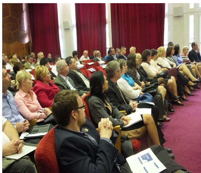
Salgótarján, szakmai konferencia

A végrehajtás szakaszában a már korábban kialakított járási felelősökből álló rendszer továbbra is megmaradt, ezen kívül a munkatársaink között felosztásra kerültek a felhívások, így mindenki olyan témával foglalkozhat, amely hozzá közel áll, vagy szakmai előélete alapján abban jártassággal rendelkezik.